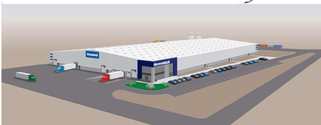
Deceuninck extrusiefabriek in opbouw in Fernley (nabij Reno,NV), in het westen van de VS